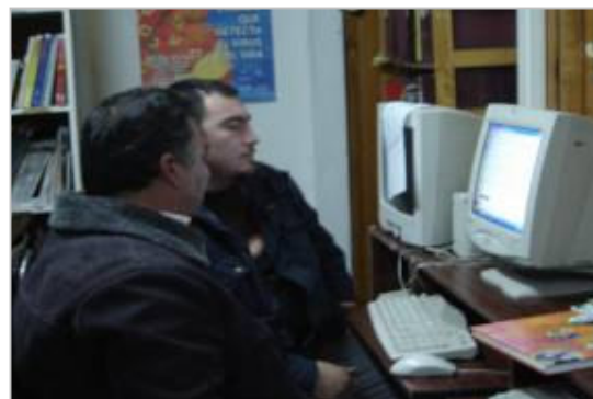
Profesores y Líderes de la Escuela Central Quilaco Padre Las Casas, Temuco.